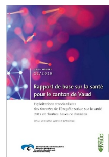
Rapport/Rapport de base